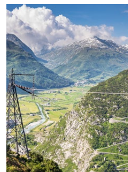
Rapport de durabilité